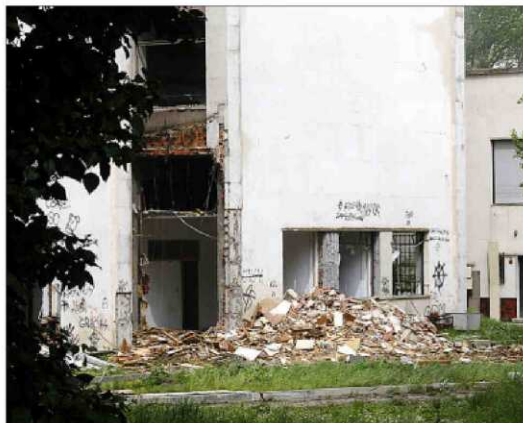
Escombros acumulados en la parte trasera de la sede Mergelina de la UVa.

La construcción derribada constaba de seis alturas, además de la planta baja, con una superficie de 800 metros cuadrados por cada una, lo que significa que la superficie derribada superior a los 5.000 metros cuadrados. Será un entorno, además, donde se levante una moderna construcción, de mayor altura, lo que permitirá centrar allí el aulario, las clases, los laboratorios, los despachos y otras dependencias de la Facultad de Ciencias de la UVa. Así, está obra de ejecución de la torre aulario de la sede Mergelina de la Escuela de Ingenierías Industriales que incluye el derribo salió a concurso público por 5,7 millones de euros, IVA